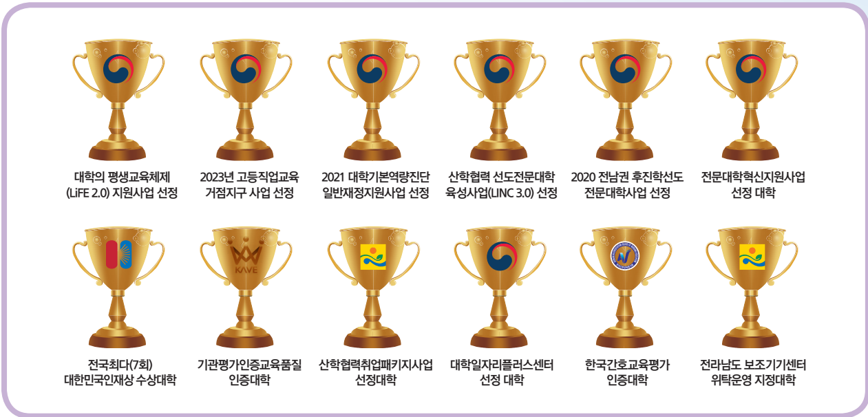
대학의 평생교육체제 (LiFE 2.0) 지원사업 선정 2023년 고등직업교육 거점지구 사업 선정 2021 대학기본역량진단 일반재정지원사업 선정 산학협력 선도전문대학 육성사업(LINC 3.0) 선정 2020 전남권 후진학선도 전문대학사업 선정 전문대학혁신지원사업 선정 대학 전국최다(7회) 대한민국인재상 수상대학 기관평가인증교육품질 인증대학 산학협력취업패키지사업 선정대학 대학일자리플러스센터 선정 대학 한국간호교육평가 인증대학 전라남도 보조기기센터 위탁운영 지정대학